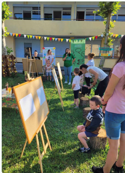
↑ Активни квартали – интервенция в Харманли / ДГ „Ален Мак“