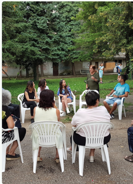
↑ Плейсмейкинг интервенция в Берковица / Сдружение |НЕ|Формално