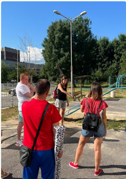
Плейсмейкинг за демокрация